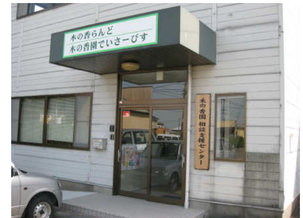
きたこが じぎょうしよ き かえんそうだんしえん 北古賀事業所・木の香園相談支援センター

障害のある方やご家族からの相談をお受けするほか、介護給付等、支給決定を受けた方に「サービス利用計画書」を作成します。お気軽になんでもご相談下さい。