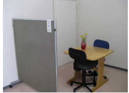
そう だん しつ 相談室