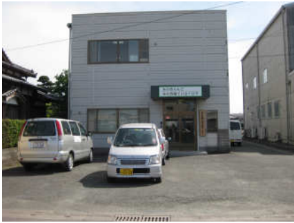
じぎょうしょぜんたいふうけい 事業所全体風景