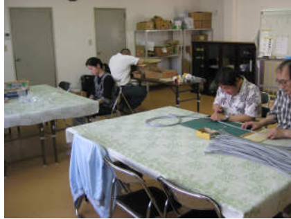
さぎょうばふうけい 作業場風景