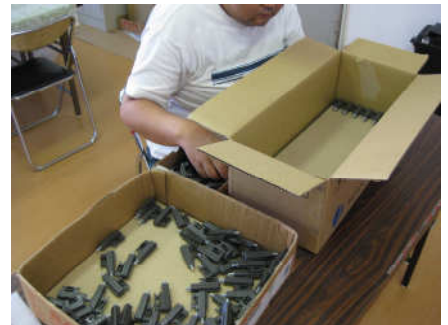
養殖用のり袋・下請け作業