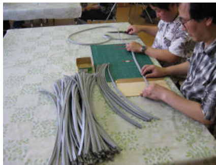
家具の部品・下請け作業

皆様、健康状態など心身の状態にあわせて仕事に取り組まれています。 企業からの下請け作業を中心にいろいろな仕事を請け負っています。