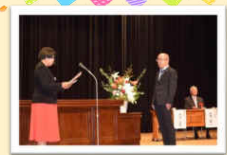
【功労者・永年勤続者表彰】