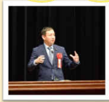
衆議院議員 鳩山二郎氏 祝辞