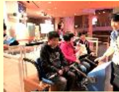
～玄海エネルギーパーク～ 発電についての勉強をしました。