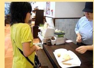
<買い物実習> パンを買えました(#^^#)