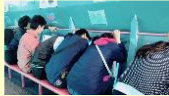
海の中の魚をたくさん見たよ (<^>)))ゞ