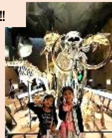
～いのちのたび博物館では命の営みを学習してきました～