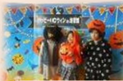
海響館でハッピーハロウィン(ハ・ハ)