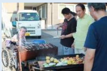
焼き方でがんばる皆さん。

休みの日は、料理が好きな利用者さんを中心に、自分たちで食事を作られています。また、レクリエーションでは、日帰り旅行やBBQ大会をしました。BBQは、役割を決めて、利用者の皆さんが準備や進行をされました。たくさんのプログラムや季節ごとの行事を提供しています。