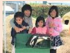
ペンギンに触れた♥