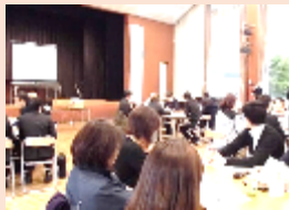
研修・情報交換会の様子

木の香園相談支援センターでは大川市委託相談事業、障害支援区分認定調査、サービス等利用計画書作成に係る業務を行うとともに、自立支援協議会での障害福祉サービスにおける現状把握及び対策を協議し、情報提供や意見交換を行うことで、関係機関との連携を深めています。