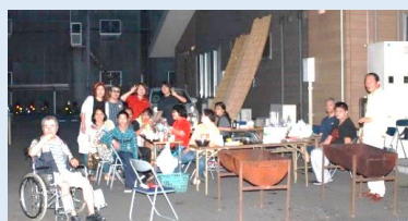
みんなで食べるBBQはおいしかった。