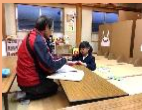
<学習支援> 勉強も頑張った!(^^)!