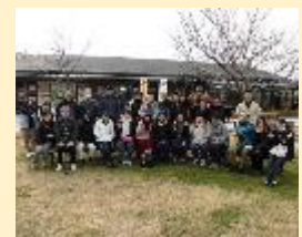
長崎研修・日帰り旅行 2017年 忘年会