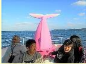
ジーラに乗ったよ(^^)