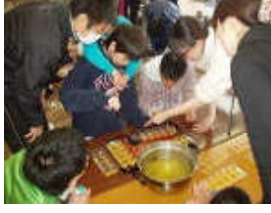
(お菓子作り) 皆パティシエになっていろいろなお菓子を作ったよ。