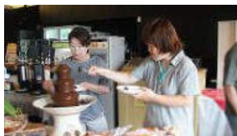
熊本日帰り旅行 玉名方面へ行きました。