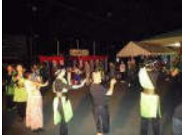
皆の頃に最高潮を迎えました