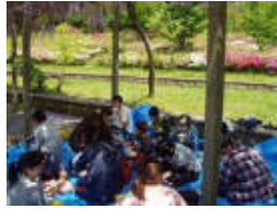
(外での食事) 外で食べると美味しいね。