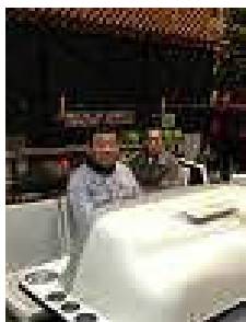
ボウリング をま ライク 狙っていき ました。