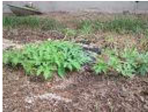
【6月25日】 あまり変わらない様子・・・。

道海島事業所では建物の温度を下げる 目的として約二ヶ月間ゴーヤを育て、緑 のカーテンを完成させました☆