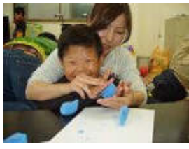
(粘土さいく) 何を作ろうかなあ