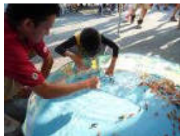
駐在所の横には林業スペースが盛大に出た