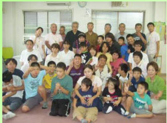
北古賀事業所集合写真