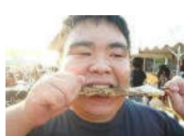
この焼き鳥はおいしいなあ～