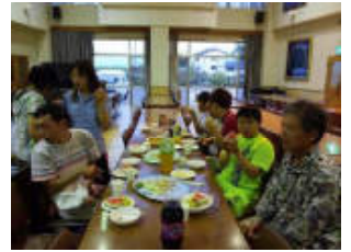
【宿泊訓練】 6月 1日目はふれあいの家で軽スポーツやス イカ割りをして過ごし、2日目は大牟田市の 動物園に行きました。昼食はジョイフル ランチでした♪