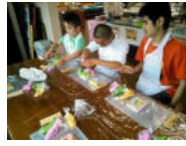
(かまぼこ作り) かまぼこ作ったよ。上手く出来たかな？