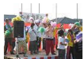
元々でも披露された各事業所でも披露しました