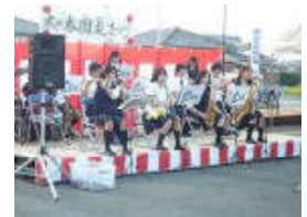
オープニングは大川樟風高校吹奏楽部の演奏でした