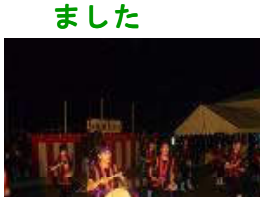
職員の強い音波によるエイサーの夜祭り