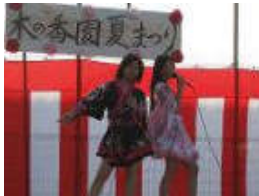
木の香園のアイドルユニットMA MISAKIが会場を盛り立てました