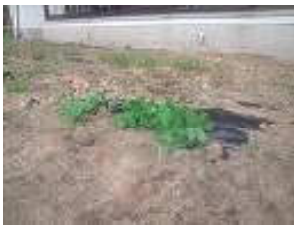
【6月19日】 植えたての頃の様子。まだまだカーテンにはほど遠い？