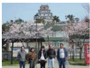
佐賀県北部へ 唐津城の桜を見ました。