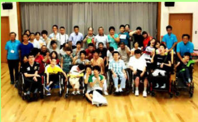
下林事業所集合写真

◇共同生活援助（グループホーム） 木の香ほーむ <小保事業所> 〒831-0041 福岡県大川市大字小保470-3 電話・FAX 0944-32-9921