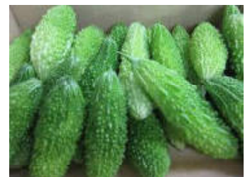
【8月30日】 緑のカーテンの完成です！ ゴーヤもたくさん収穫でき ました♪