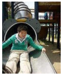
(滑り台) ぼくが一番～。