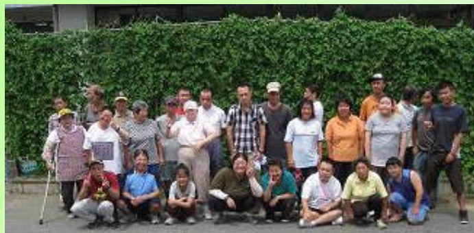
道海島事業所集合写真