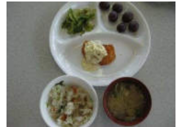
【9月19日】 収穫したゴーヤを使って調理実習を 行いました。 ゴーヤのおかか和えも美味しくでき ました (*^◇^*)