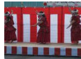
フラダンスはゆったりと見せました