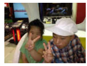
(柿添さん&手柴くん) 運転手は私です。