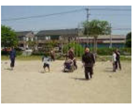
(かけっこ) 皆で競争だ～。