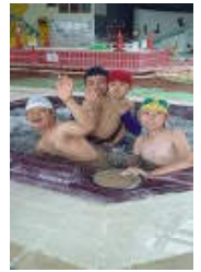
(プール) 温水で気持ちいいよ。