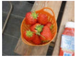
(イチゴ狩り) 美味しそうなイチゴをたくさん狩ったよ。