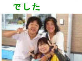
利用者も職員も楽しめました