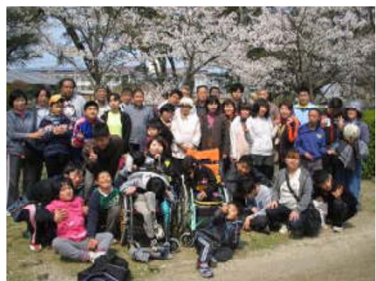
北古賀事業所全員でお花見をしました。