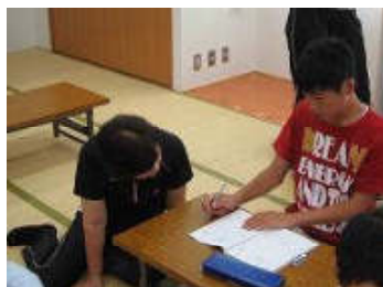
2011夏休み宿題をしています。