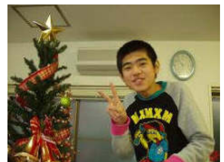
クリスマス会。サンタさんからプレゼントをもらいました。