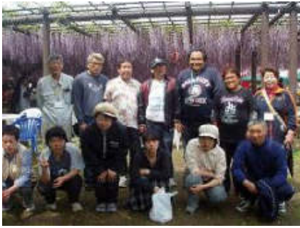
<大藤見学> とても綺麗かったです。