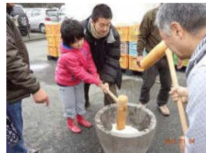
2012年年始のお餅つきです。