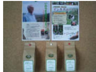
木の香らんどコーヒー