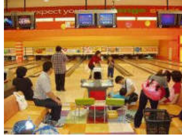
<ボウリング> リラックスして楽しみました。