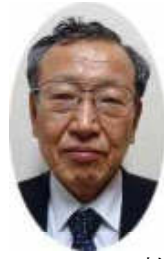
社会福祉法人大川市福祉会 下林事業所