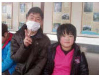
足湯へ行きました。とてもあたたかかったです。