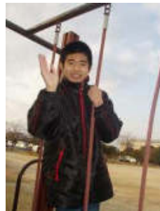
2012春休みでのようすです。