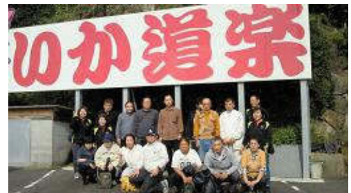
<レクリエーション>唐津へ呼子のイカを食べに行きました。