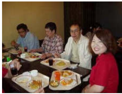
<日帰り旅行> ハウステンボスへ行ってきました。