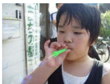
しゃぼん玉あそび