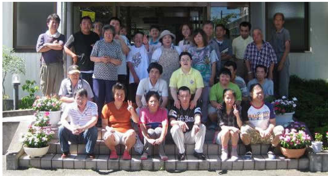
◆木の香園就労支援センター集合写真 平成24年7月