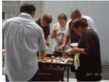
<バーベキュー> おなか一杯食べました。